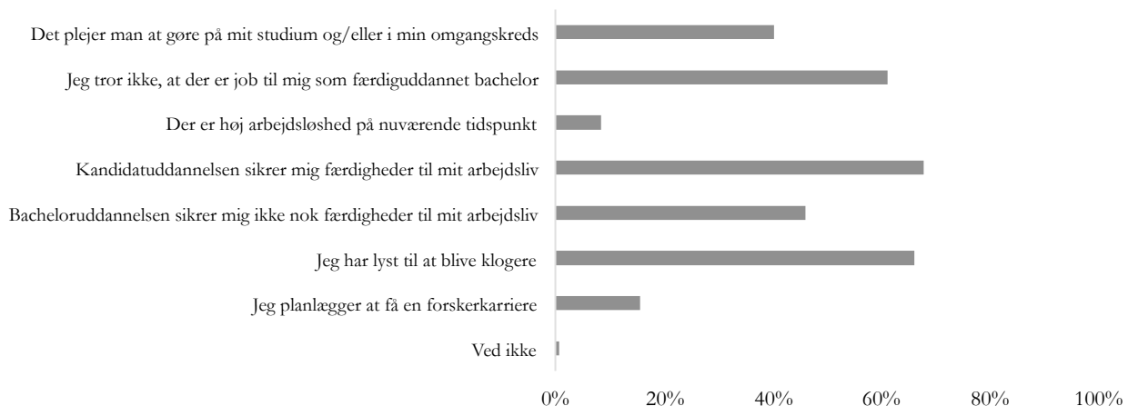
Figur 3: Bachelorstuderende årsager til at ønske en kandidatuddannelse 3

Bachelorstuderende spørges til hvilke årsager der er til, at de ønsker at tage en kandidatuddannelse. Tre årsager nævner over halvdelen: 1) at kandidatuddannelse sikrer dem færdigheder i deres arbejdsliv, 2) at de har lyst til at blive klogere og, 3) at de tror ikke, at der er job til dem som færdiguddannede bachelorer.