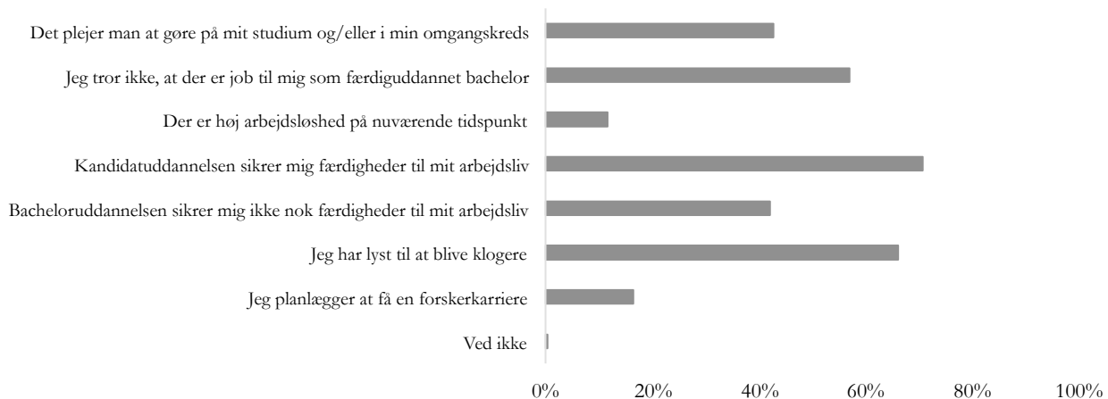
Figur 4: Kandidatstuderendes årsager til at tage en kandidatuddannelse 5